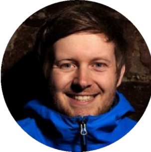
Michael Groß Website & Online Fundraising